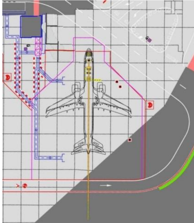
Figura 1 stand 501