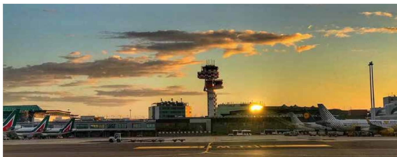
Alba in pista

Il mio primo amore è stata la tecnologia: ho iniziato come programmatrice di computer, un'esperienza durata 17 anni e orientata verso il futuro. Da buona informatica, ho seguito il detto di Steve Jobs: 'L'unico modo per fare un ottimo lavoro è amare quello