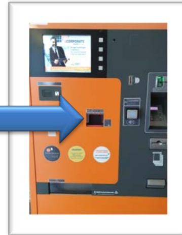
FOTO 3 PASSARE IL Q-CODE NEL LETTORE OTTICO