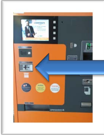
FOTO 1 PREMERE IL PULSANTE VERDE E RITIRARE IL BIGLIETTO