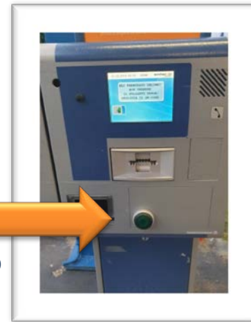
FOTO 2 INSERIRE IL BIGLIETTO NELL'APPOSITO LETTORE